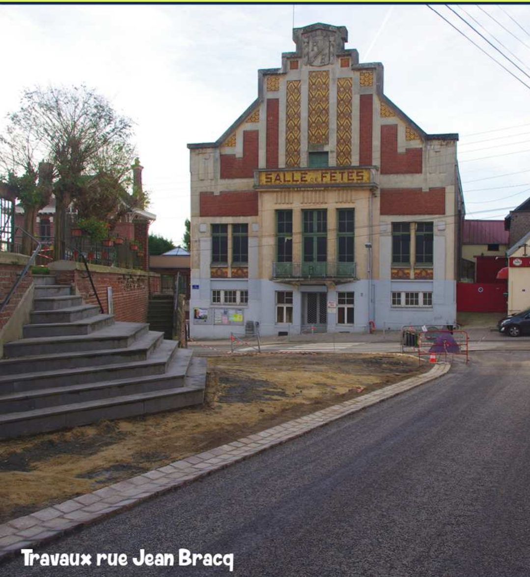
Travaux rue Jean Bracq