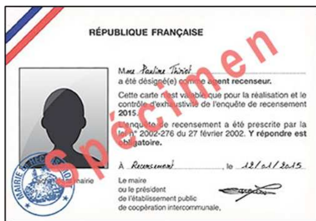
Carte d'agent recenseur

Les agents se présentent chez les personnes à recenser pour leur remettre la notice sur laquelle se trouvent leurs identifiants de connexions au site le-recensement-et-moi.fr . Si elles préfèrent remplir le questionnaire papier, les agents leur distribuent une feuille de logement et autant de bulletins individuels que compte le logement, puis conviennent d'un rendez-vous pour venir les récupérer. Votre commune vérifie la bonne prise en compte de tous les logements recensés.