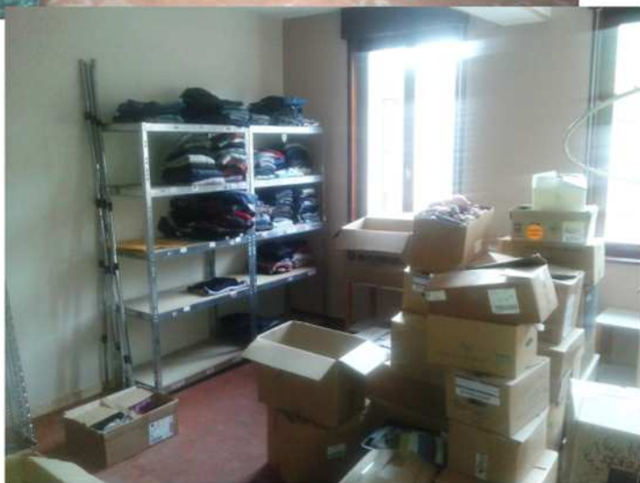
Les nouveaux locaux rue du Temple