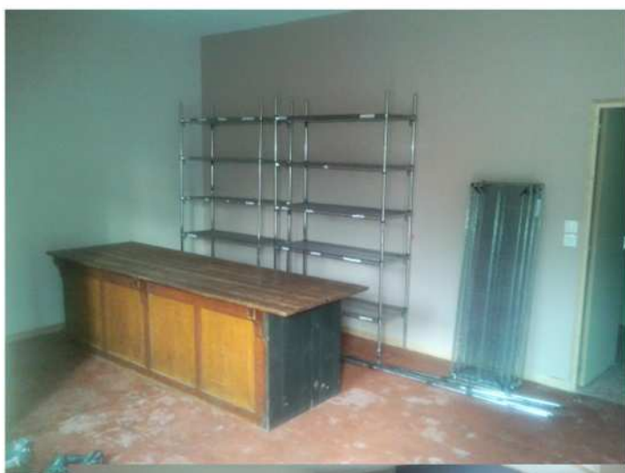
Les anciens locaux à l'ancienne coop.

La prochaine ouverture des locaux se déroulera le 19 janvier de 14h à 16h dans les nouveaux locaux.